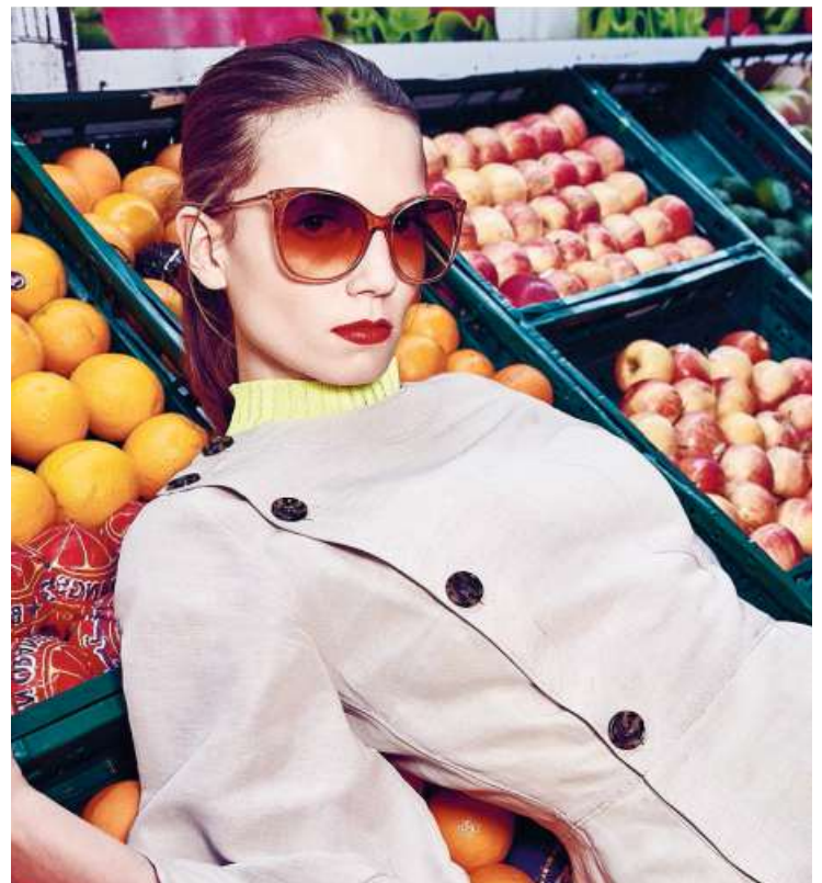
Brille «Effie», 345 Fr., von Andy Wolf; andy-wolf.com

Berlin, genauer gesagt in die Potsdamer Strasse, umgezogen. Das multikulturelle Kiezleben inspirierte die Österreicher sogleich zur aktuellen Herbst/Winter-Kollektion «Love» und der Kampagne «Love Potse», wo die extravaganten Modelle im türkischen Supermarkt oder in der Fleischerei Staroske in Szene gesetzt wurden. Hierzulande sind die Gestelle etwa bei Götte oder Gautschi Optik in der Zürcher Innenstadt erhältlich. (ijo.)